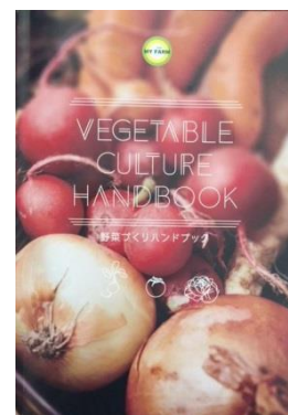
〈テキストイメージ〉

オリジナルテキストを用いて、マイファームの講師陣が野菜苗の選び方や植え方、栽培方法など家庭菜園の基本から、病害虫対策、保存・調理方法に至るまでシーズンを通してレクチャーします。さらに堆肥づくり、農場体験などの実地練習を行うなど実践的な内容となっています。また、受講生にはマイファームが運営する日本最大級の家庭菜園 SNS「Cropne」の活用により、受講生同士の交流の場を提供します。