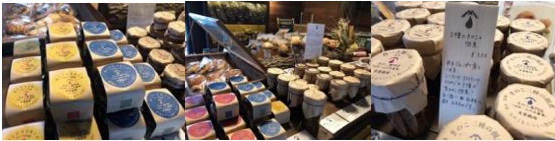
セミドライキノコ オイル漬け 加工品は直営店舗のみ販売 三種のきのこの佃煮

直営の拠点として、白州・山の水農場きのこ専門店を運営。北杜市白州町の旧甲州街道の蔵を改修し、旬のきのこやドライきのこ、きのこ加工品、地元の美味しいセレクト農産物・焼き菓子・パンなどを販売。観光の拠点として立ち寄ってみたいくなる地域の魅力を発信している。