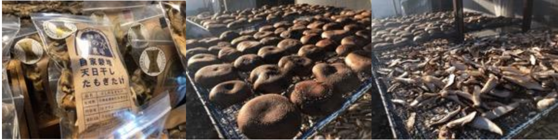
ドライきのこ 特選丸干しいたけ カット乾燥しいたけ