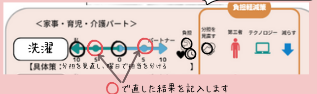
〈ワークシートの記載例〉